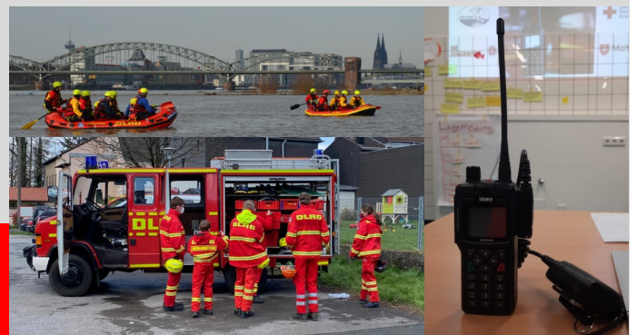
SR-Lehrgang (oben links), 24 Stunden Dienst (unten links), BOS-Sprechfunker (rechts)

Wir hoffen auch in den kommenden Monaten weiter in Präsenz Übungsdienste und Lehrgänge, mit einer so großen Beteiligung, umsetzen zu können.