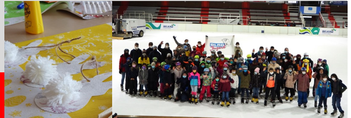
Osterhasen und Eislaufen

Dazu gab es noch leckere Waffeln und ein wenig Bewegung draußen. Doch auch im weiteren Verlauf des Jahres sollen noch weitere Aktionen stattfinden. Informationen dazu gibt es auf der Website und beim Training.