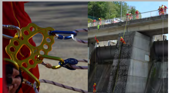
Strömungsretter bei unterschiedlichen Seiltechnikübungen im vergangenen Jahr