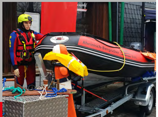
Das neue IRB (Inflatable-Rescue-Boat) des Rheinisch-Bergischen-Kreises

Wir bedanken uns für alle netten Gespräche und Spenden, welche wir über den Tag erhalten haben und freuen uns schon auf das nächste Stadtfest.