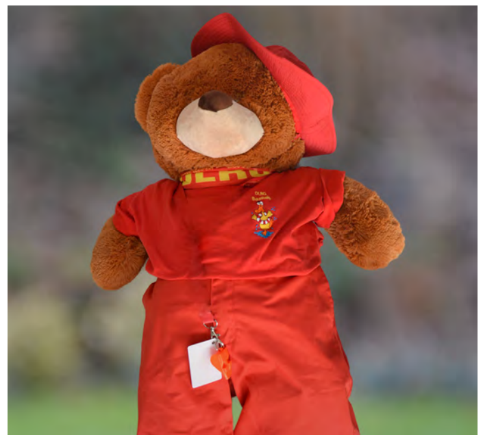
Auflösung unter „Termine und Sonstiges“