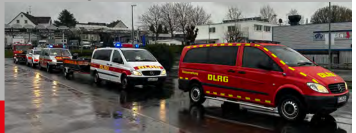
Fahrzeugkolonne auf den Weg ins nächste Übungsgebiet

Am folgenden Tag wurde bei anhaltendem Regen auch die Evakuierung eines Geländes mit anschließendem Transport per Boot über dem Rhein geübt.