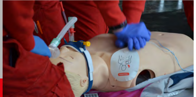
Sanitätsausbildung der Einsatzkräfte

Wenn Erste Hilfe Kurse angeboten werden, könnt ihr euch auf unserer Website anmelden.