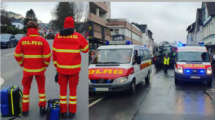
Karnevalsdienste in Leichlingen und Bergisch Gladbach

Zudem waren drei unserer Strömungsretter auf dem Lehrgang Seiltechnik beim Landesverband Nordrhein. Weitere Lehrgänge laufen aktuell.