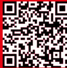
Link zur unserer PayPal Spendenseite

Ab sofort kann auch der Zahlungsdienst PayPal verwendet werden, um die Ortsgruppe zu unterstützen.