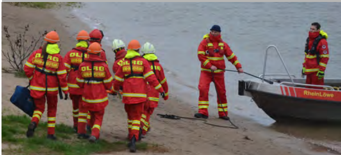
Transport einer Person mit Übergabe an das Boot

Bei regelmäßigen Übungsdiensten üben unsere Einsatzkräfte, wie auch unser Jugend Einsatz Team (JET) den Umgang mit dem Material und bereiten sich auf unterschiedliche Szenarien vor. Dabei sind unsere Kräfte auch außerhalb von Burscheid sehr aktiv, um möglichst gut auf die Gegebenheiten im Rheinisch-Bergischen Kreis vorbereitet zu sein.